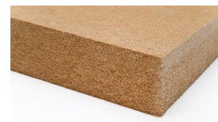
AGEPAN® THD Install – einzigartige Festigkeit durch das asymmetrische Rohdichteprofil

Das WEM Klimatelement als Lehm-Trockenbauplatte zum Heizen / Kühlen und AGEPAN® THD Install sind die ideale Verbindung, wenn es um den nachhaltigen, energetischen Innenausbau in Trockenbauweise geht. Dieses System verbindet Dämmung und Klimatisierung in professioneller Weise. Eine schnelle Montage, ein geringer Feuchteintrag und zudem nachhaltige, natürliche Baustoffe - das sind die Vorteile dieses Systems, das sowohl für Wände, Dachschrägen als auch Decken geeignet ist.