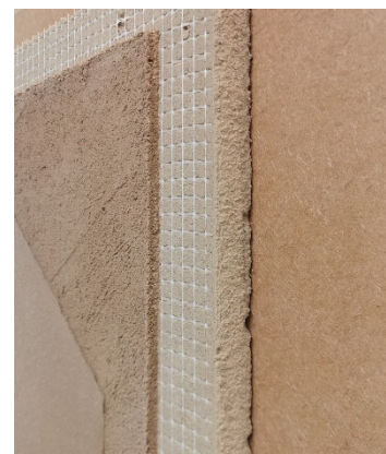
Holzfaserdämmplatte AGEPAN® THD Install und WEM Klimatelement – eine ideale Kombination

Gerade für den Neubau ist die Ausführung sehr unkompliziert und einfach in der Handhabung. Auf der nach Herstellervorschrift ordnungsgemäß angebrachten AGEPAN® THD Install wird das WEM Klimatelement aufgeschraubt und anschließend verputzt. Durch die extrem hohen Konsollasten der AGEPAN® THD Install von bis zu 25 kg pro Schraube, ist ein sicherer Halt des WEM Klimatelementes gewährleistet. Durch die Befestigung der Flächenheizung in der Deckschicht der Holzfaserdämmplatte werden Wärmebrücken vermieden, die beim Durchschrauben entstehen würden. Wird die AGEPAN® Holzfaserdämmplatte im Altbau als Innendämmung eingesetzt oder das WEM Klimatelement auch zum Kühlen verwendet, ist aus bauphysikalischen Gründen eine Verklebung der Flächenheizung auf der AGEPAN® THD Install mit dem WEM Lehmkleber nötig.